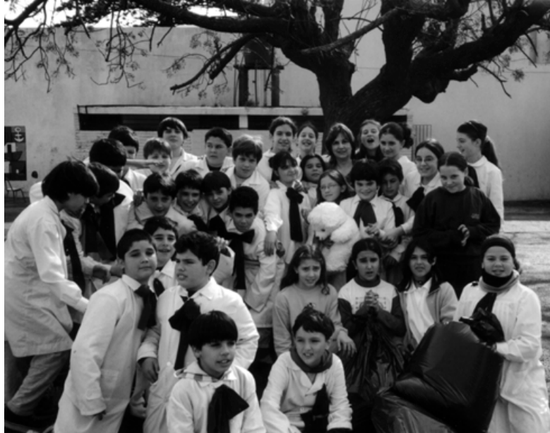
Brigada de Apoyo Solidario organiza campaña de alimentos, ropa y juguetes