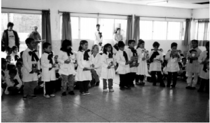
Niños, madres y padres se encuentran y comparten actividades escolares.