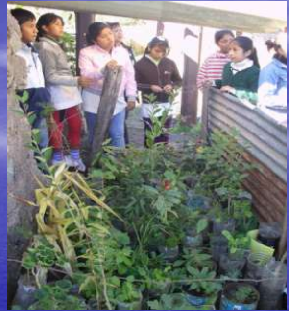
Forestación en la plaza del pueblo

Producción de especies nativas: Roble Americano