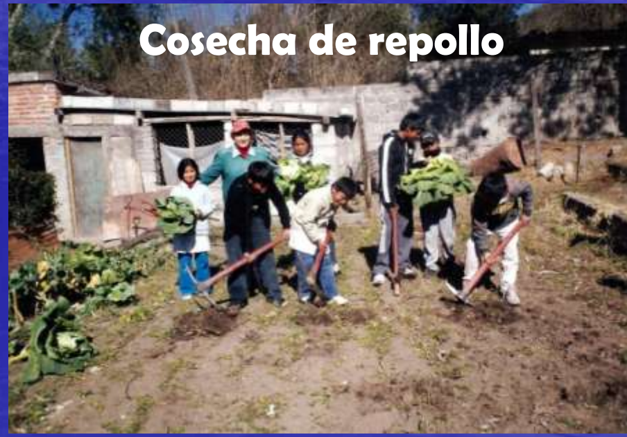
Cosecha de repollo