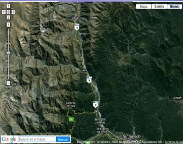
UBICACIÓN GEOGRAFICA LEON MAPA SATELITAL