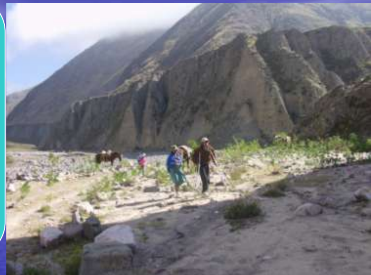
EL CHAÑI a 4000 M.S.N.M.

UBICACIÓN A 27 km al Norte de San Salvador de Jujuy