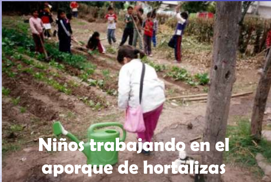
Niños trabajando en el aporque de hortalizas