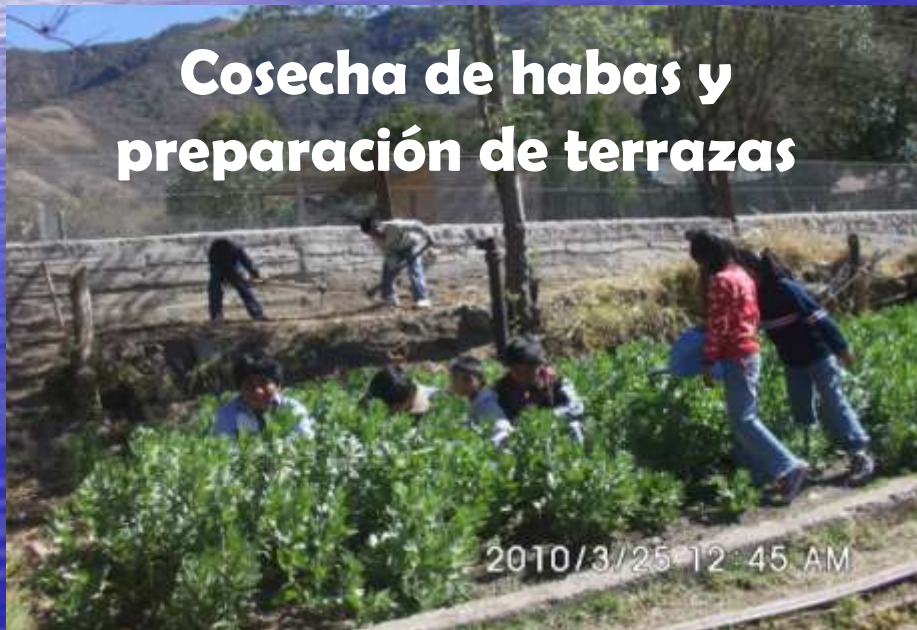
Cosecha de habas y preparación de terrazas