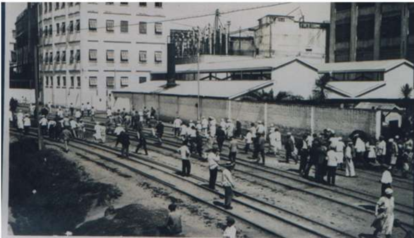
BERISSO. Frigorífico Swift. Salida del Trabajo