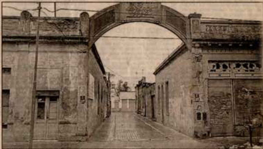
Toda la historia de la calle Nueva York se verá reflejada en el museo que quiere crear la Escuela N° 9

Di Paolo explicó que el proyecto se halla en su etapa inicial, de difusión y búsqueda de adhesiones, y que en los próximos días