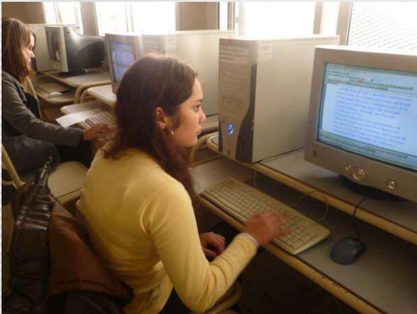
Preparación de las fichas turísticas