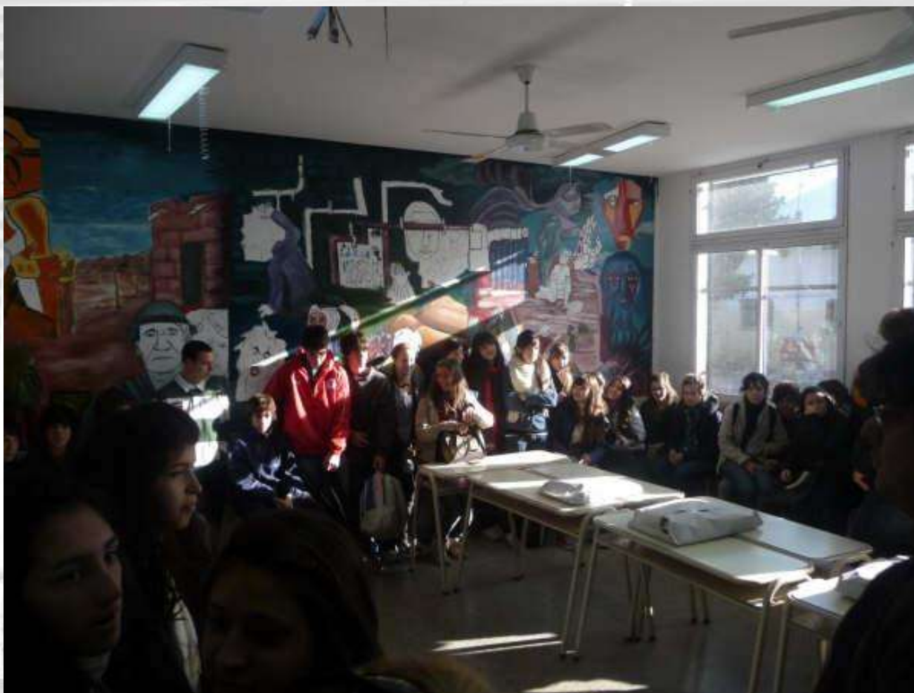
Recorrido realizado con el Colegio Nacional "Rafael Hernandez". La Plata.