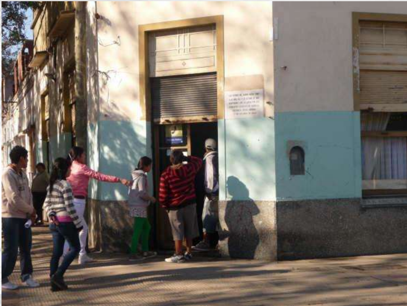
Bar Inglés Dawson