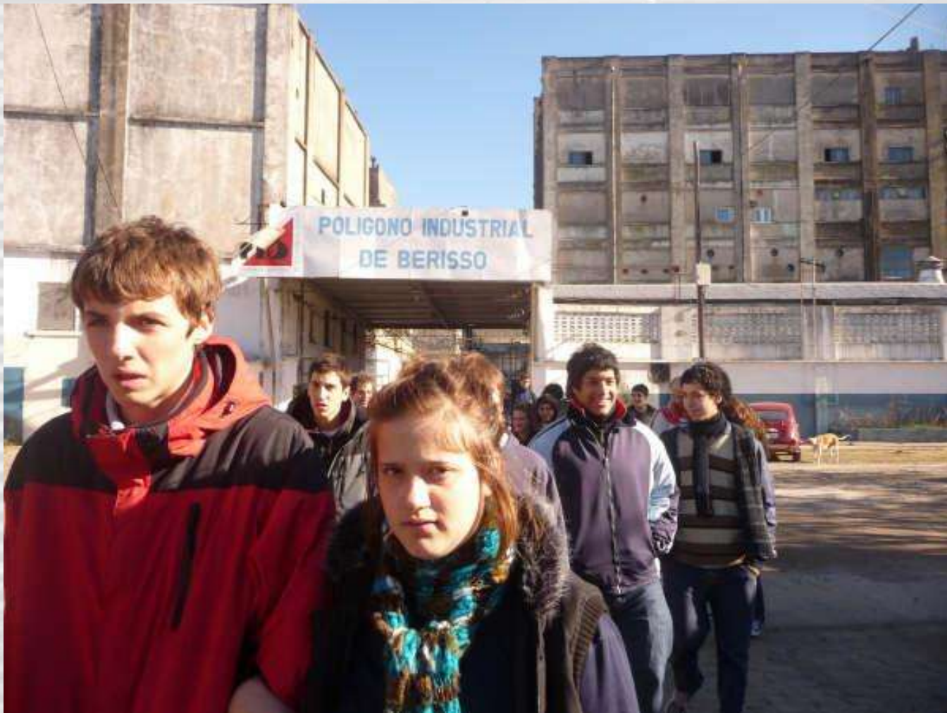
Entrada a los frigoríficos