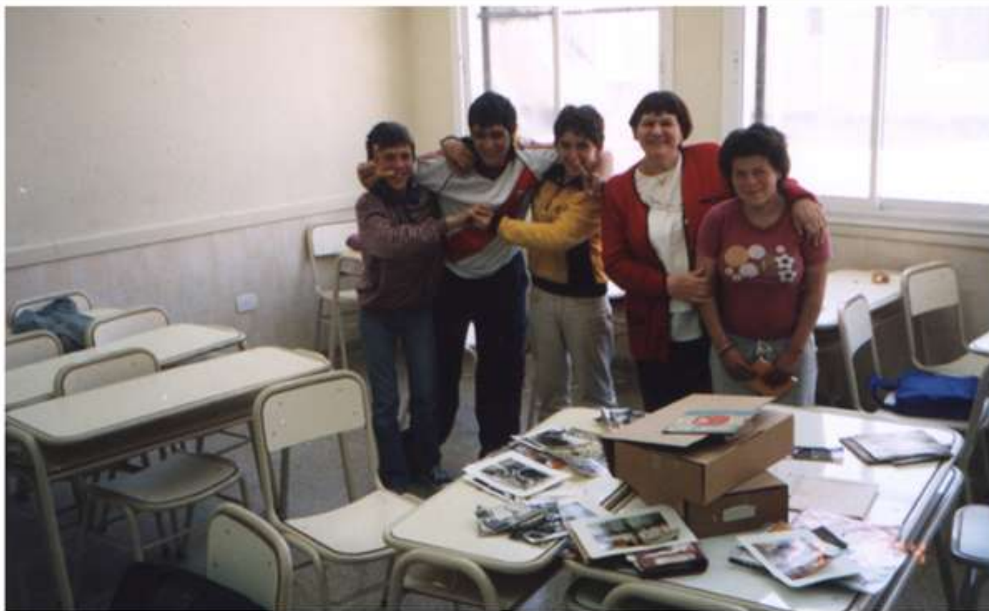
E.G.B. N°9 - AMERICA