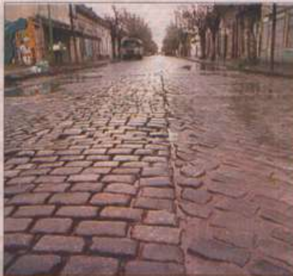
Un tramo de la calle Nueva York, que ayer fue declarada como Sitio Histórico por el presidente de la Nación. Ahora deberá ser preservada como tal por la Comuna y los vecinos.