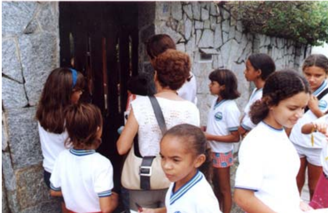
Campanha de combate à Dengue promovida pelos alunos