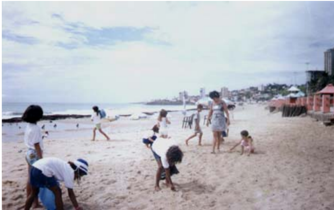
Coleta de lixo reciclável realizada pelos alunos da Escola Estadual Professora Olda Marinho na Praia do Meio.