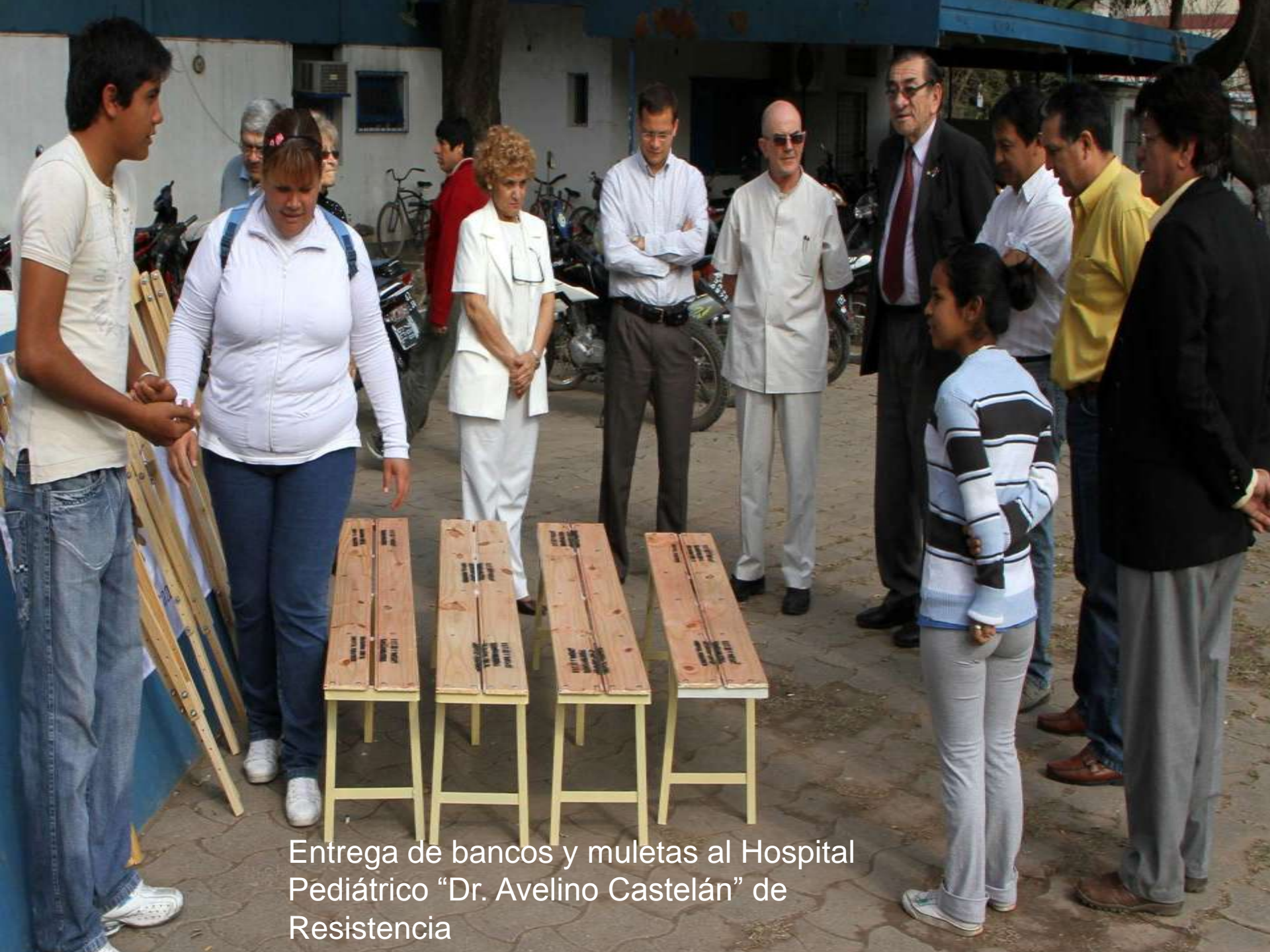
Entrega de bancos y muletas al Hospital Pediátrico "Dr. Avelino Castelán" de Resistencia