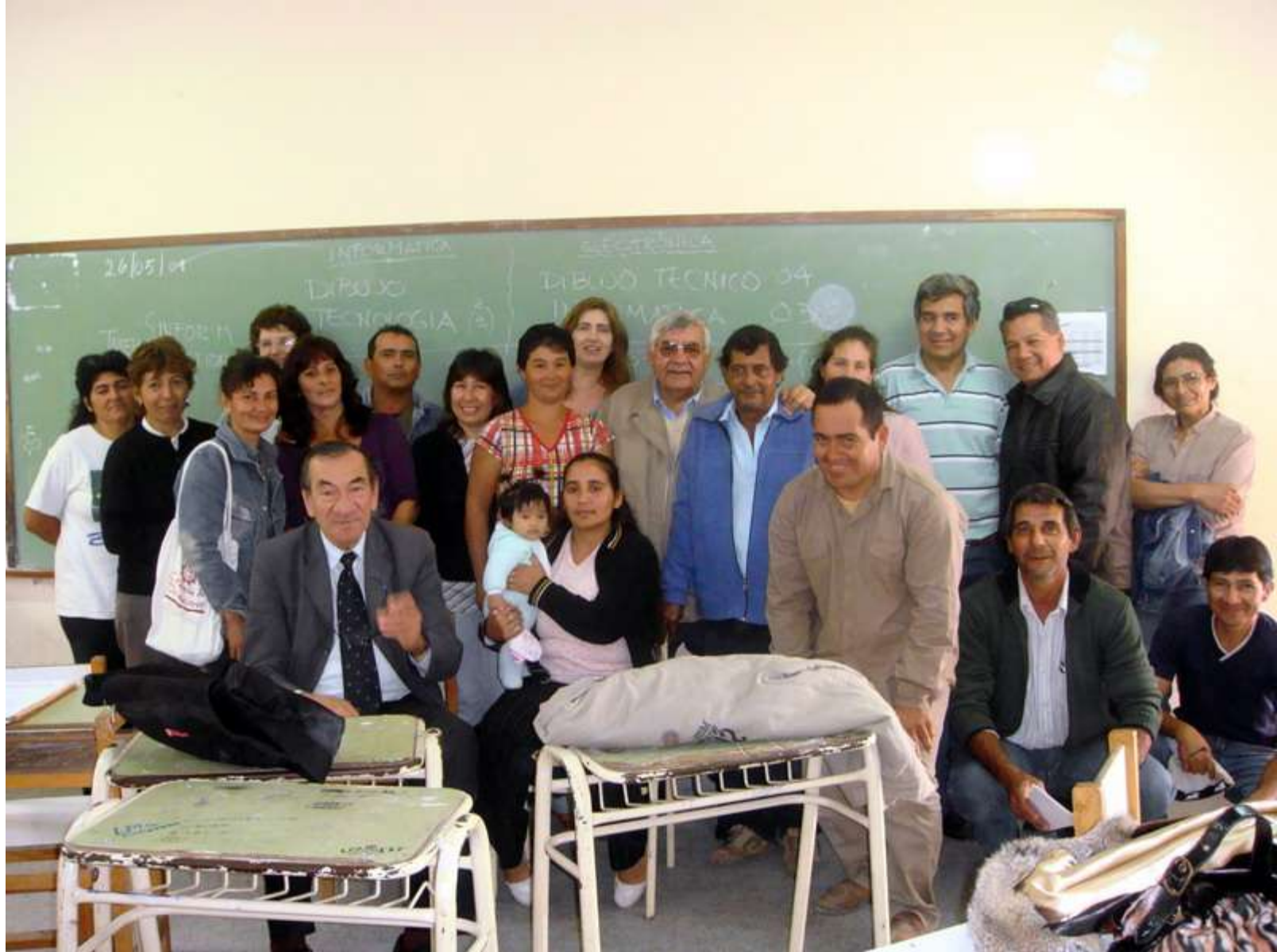
Vecinos del Barrio Las Malvinas reunidos en la Escuela para agradecer donación de elementos para personas con discapacidad