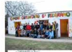
Villa Ana: Refacción de un comedor comunitario