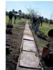
Villa Ana: Refacción plaza del primer EI