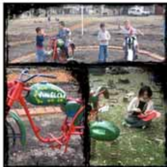
Villa Ana: Construcción de una plaza

Intervención de voluntarios internacionales, grupos locales y Subir al Sur en el espacio público