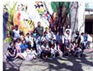
Villa Ana: Refacción de un edificio para utilizarlo como museo