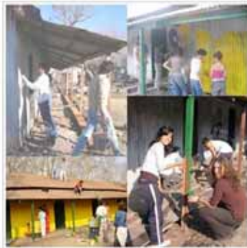
Clorinda: Trabajo barrial, plantación plantines y restauración plaza