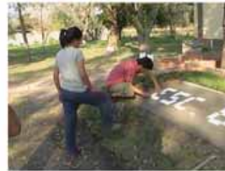
Villa Ana: Refacción del playón de una escuela