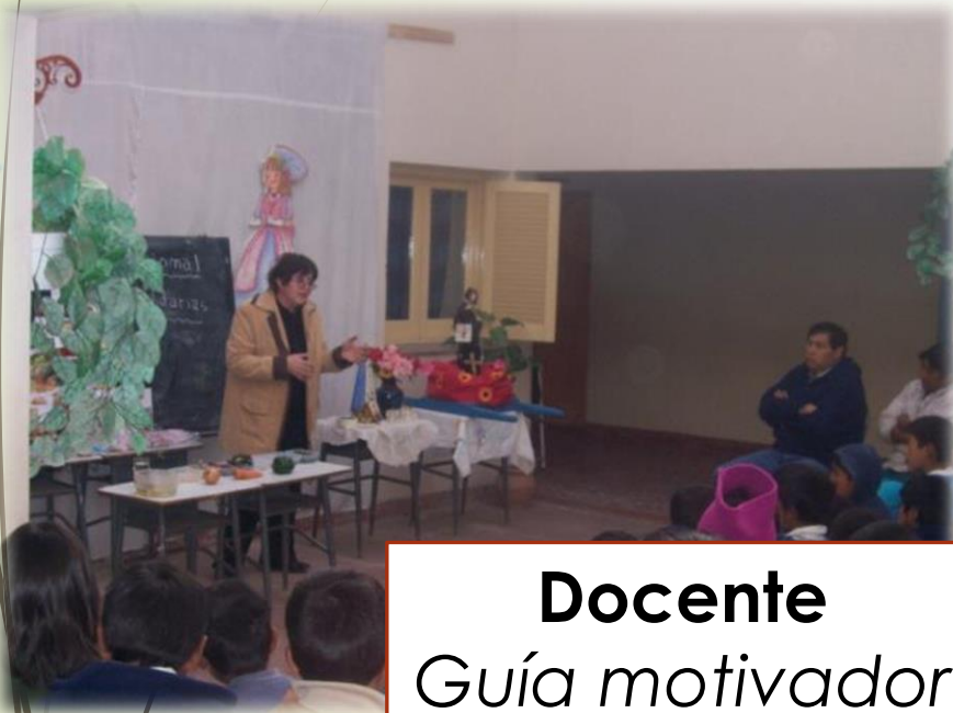
Docente Guía motivador