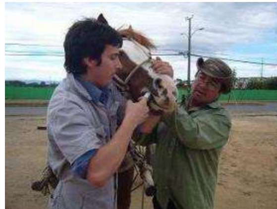
Universidad Austral, Valdivia