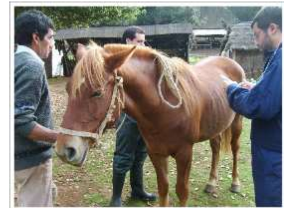
Universidad Católica de Temuco