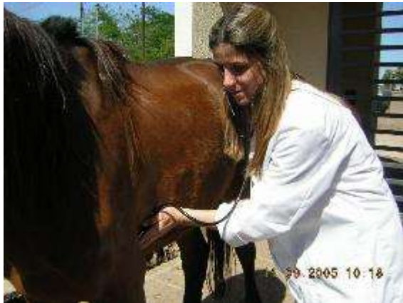
Universidad Nacional de Rosario

Clínicas para caballos “cartoneros” o “carretoneros” e investigación sobre salud equina en contextos urbanos de extrema pobreza. Facultades de Veterinaria de la Argentina y Chile.